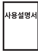
1. 사용 설명서